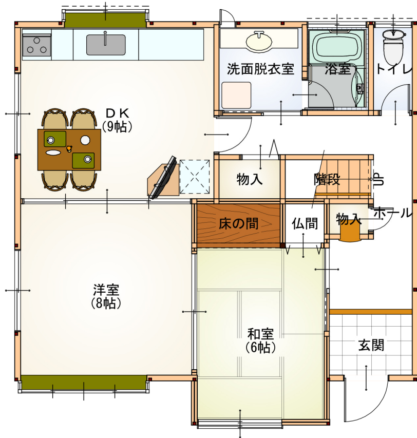
1階 平面図 S:1/80